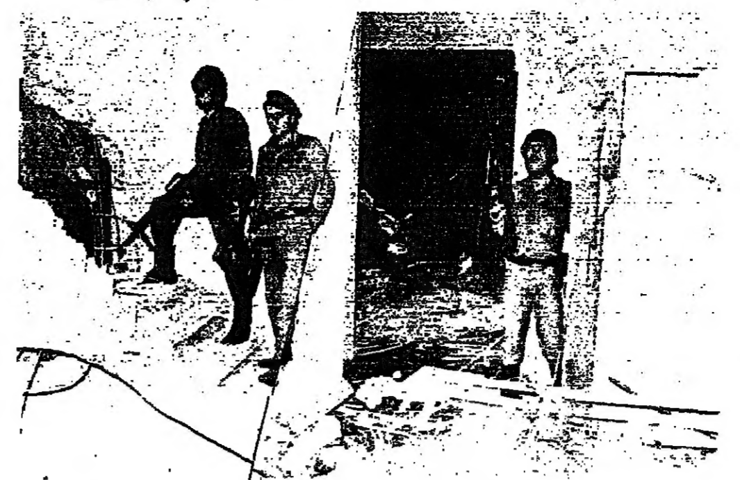
بعض رجال « الفرقة ١٦ » في منزل اصيب بالقذائف في الدكوانة